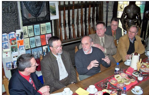
2004: Informationsveranstaltung im Rittersaal der Laurenburg mit Landrat Kern, VG-Bürgermeister Klöckner und dem MdL Frank Puchtler

Nach der Vertreibung aus Pommern kam die Familie über Schwerin, Duisburg, Klein-Umstadt auf die Laurenburg.