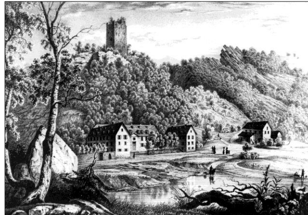
Burg und Schloss Laurenburg (Kupferstich von 1830)

Die Burg ist ganzjährig täglich (außer dienstags) von 10 bis 18 Uhr geöffnet, bei Feiern nach Vereinbarung. Im Turm befindet sich eine Militaria Sammlung. Getränke können preiswert gekauft werden. Kontaktadresse: Burg Laurenburg, 56379 Laurenburg, ☎ 06439/6601