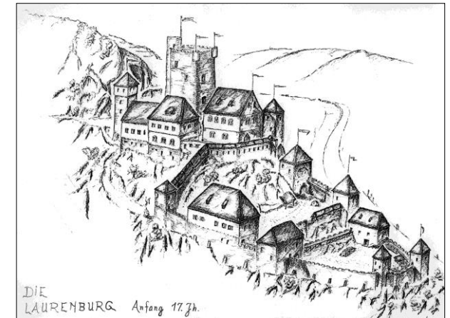
Zeichnung von Bernd Hasbach

Diese Wanderungen können beliebig verlängert werden, indem man in Diez, Fachingen oder Nassau beginnt oder das Jammertal, das Gelbachtal (von Obernhof), das Daubachtal und das Schwarbachtal (von Balduinstein) einbezieht. Wir empfehlen die topographische Karte 1 : 50 000 „Naturpark Nassau“ mit Wander- und Radwanderwegen (in der Burg erhältlich).