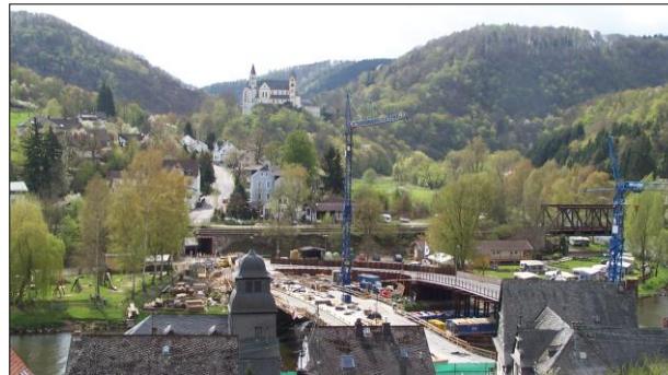
2004 – Obernhof bekommt eine neue Brücke

Über die Felsen führt ein Abkürzweg ins Tal, der aber sehr steil und beschwerlich ist. Zurück zur Pilztafel gehen wir den L weiter. Nach einer scharfen Rechtskurve zweigt sich der Weg. Links geht es direkt nach Obernhof und rechts kommt man zur Bergkuppe zwischen Obernhof und Weinähr. Wir nehmen den rechten Weg. Nach einigen Schritten kommen wir aus dem Wald heraus und können über die steilen Weinberghänge, auf Obernhof blicken. Die vielen Ruhebänke unterwegs laden immer wieder zum Verweilen ein. Wir erreichen die Bergkuppe und können hier entscheiden; Rechts geht es nach Weinähr und links kommen wir direkt nach Obernhof. In beiden Orten gibt es gute Weinlokale, wo wir den Lahnwein probieren können. Bitte vorher kundig machen, welche Öffnungszeiten bestehen. Nach gutem Essen und Trinken geht es wieder zurück zu unserem Ausgangspunkt, mit Zug nach Laurenburg.