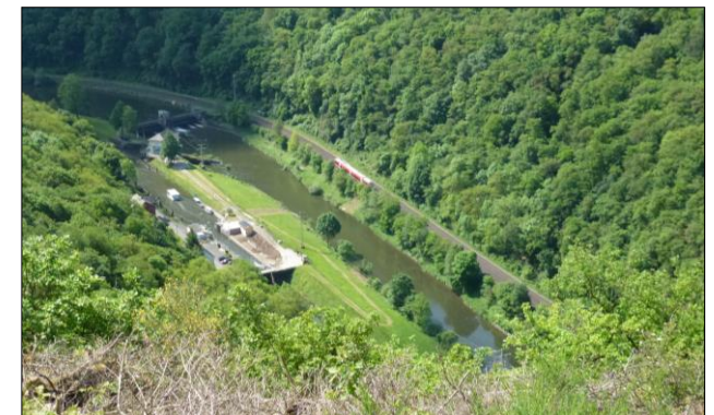
Blick von der Wolfslei auf die Schleuse Kalkofen

zählt gerne etwas von der Geschichte der Burg. Hier kann man auch Wanderkarten des Naturparks Nassau bekommen. Im Turm befindet sich eine Militariasammlung. Ein herrlicher Blick von der Wehrplatte über das Lahntal mit Laurenburg zu Füßen entschädigt uns für den Aufstieg. Nach einer flüssigen Stärkung gehen wir über den Fußweg (Krimme) nach Laurenburg. Wir kommen an der Grubenlok in Höhe der Tankstelle an die B 417 und gehen hier ca. 1,2 km Richtung Obernhof (Lahnhöhenweg); bis rechts der Waldweg zu erkennen ist. Nach einem Blick über die Wasserski-Anlage sowie einer Aussichtshütte auf einer Felskuppe mit der Brunnenburg im Hintergrund, geht es durch einen hohen Buchenwald bergan. Nach der ersten Kehre ein kleines Fichtenwäld-