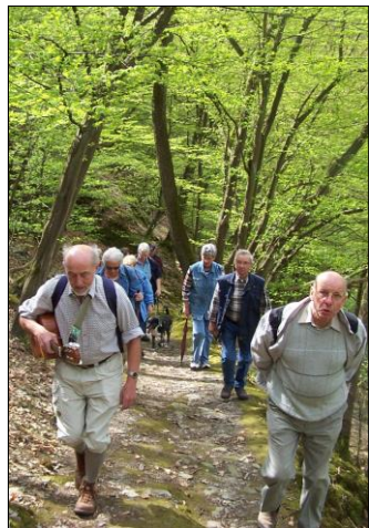
Wandergruppe zum Goethepunkt

Auch hier ein herrlicher Blick über das Lahntal. Rechts liegt Kalkofen und links die Schleuse. Das Rauschen des Wassers beim Durchlaufen der Turbinen dringt leise an unser Ohr. Nach einer kurzen Rast in der Schutzhütte geht es zurück und halblinks Richtung Dörnberg. Der Weg steigt leicht an. Um den Sportplatz ein leichter Schlenker, links der Spielplatz des Kinderheimes. Wir erreichen die Asphaltstraße. Bei guter Fernsicht ist geradeaus Scheidt, halbrechts dahinter Langenscheid und rechts Cramberg zu sehen. Wir zweigen am Friedhofs-ende nach links ab und folgen stets am Waldrand entlang der neuen Markierung des Lahn Höhenweges. Links vom Weg liegen zwei Leien mit schöner Aussicht ins Lahntal und auf die gegenüberliegende Taunushöhe. Nach 1,5 km verlässt der Weg nach rechts den Wald-