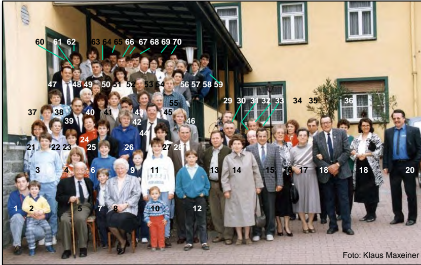
Sippentreffen der Familie Maxeiner am 4. April 1987 im Hotel „Zum Schiff“ in Laurenburg