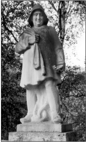
Der letzte Fährmann

Stückchen hoch auf den Weg, der uns weiter das Daubachtal hinauf führt. Die Obermühle lassen wir links liegen und gehen nicht über den Bach. (Die Obermühle, nach dem früheren Besitzer auch Gülle-Mühle genannt, ist ein Ferien- und Tagungshaus, in dem man sich mit Gruppen einmieten kann. Auskünfte beim Verein für Sozialwesen und Ökologie Gülle-Mühle e. V., Daubachtal 1, 65558 Langenscheid, Tel. 06439/202).