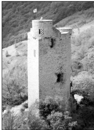
Blick von den Scheidter Felsen

N ach einem kurzen Stück über die Bundesstraße in Richtung Holzappel senkt sich links ein Weg in den Wald, dem wir folgen, dann aber nicht nach links abbiegen. Geradeaus wandern wir in leichtem Linksbogen ca. 300 m durch die Wiesen. Dann wenden wir uns nach links ins Schwarbachtal, durch das wir bis zum Geilnauer Mineralbrunnen absteigen. Bis zum Kinderspielplatz benutzen wir die Kreisstraße und danach den Leinpfad.