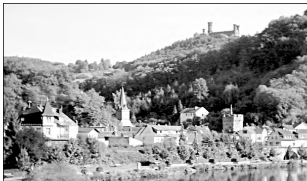
Balduinstein mit Schaumburg

Zurück auf dem Lahnhöhenweg folgen wir diesem nach rechts und steigen nach fast 1 km nach rechts ein steiles Pfädchen ab und queren über einen Steg ein kleines Bächlein. Es ist der Beginn des Höllochs, eines kleinen Schluchttälchens, das weglos steil zur Lahn abfällt und auch zu dem Naturschutzgebiet gehört. Geradeaus kom-